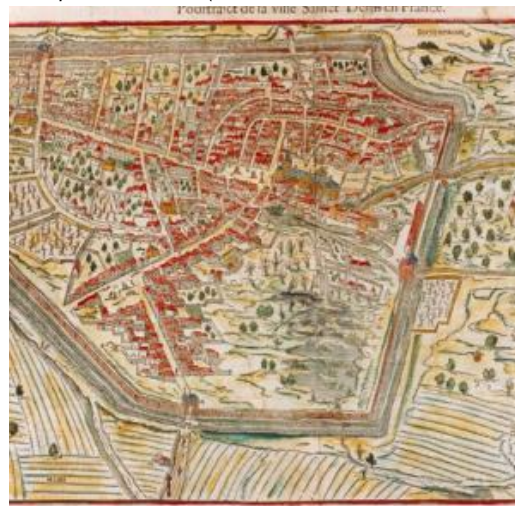
Plan de François de Belleforest, Pourtrait de la ville de Saint Denis en France, vers 1575, MAHPE