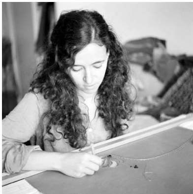
Par l'Atelier OPLATKA Espace savoir-faire (Salle de Légion d'Honneur)

Venez partager le savoir-faire d'une couturière professionnel travaillant dans les ateliers des Métiers d'art de Chanel par la démonstration d'une technique de broderies traditionnelles haut de gamme.